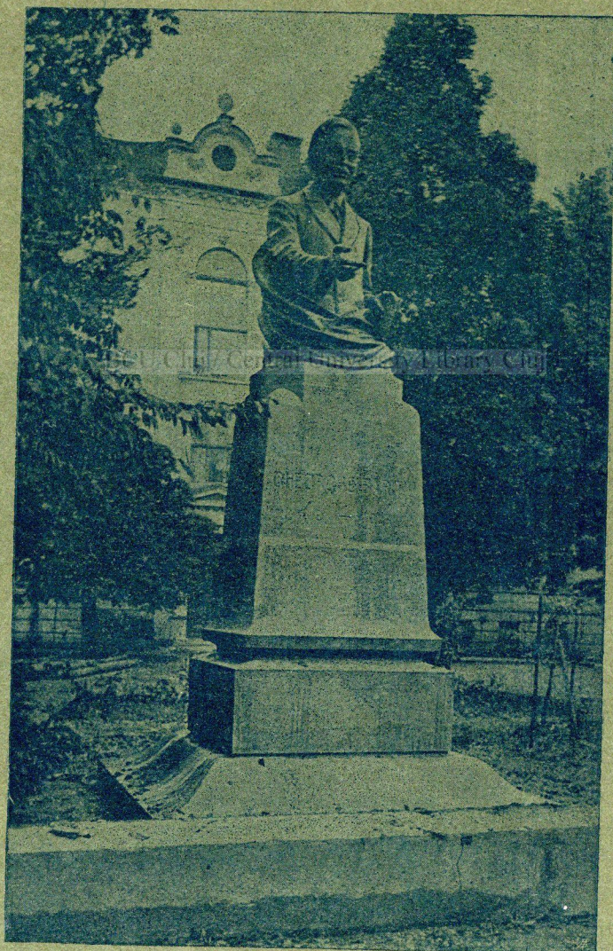
BUSTUL LUI GHEORGHE BARIȚIU Ridicat la Sibiu în fața palatului Asociațiunii culturale „Astra“.