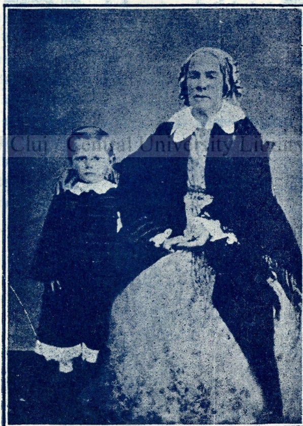
Boerimea veche românească SULTANA IANCU JIANU