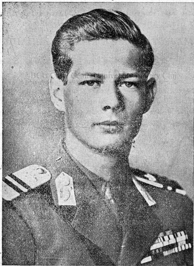
M. S. REGELE MIHAI I.