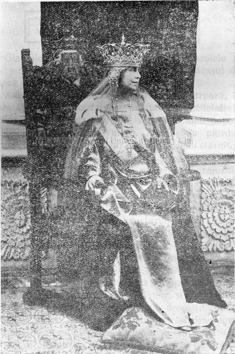
† REGINA MARIA