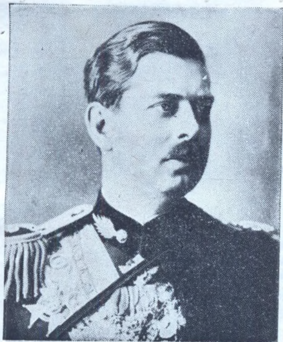
M. S. REGELE CAROL II.

BCU Cluj / Central University Library Cluj