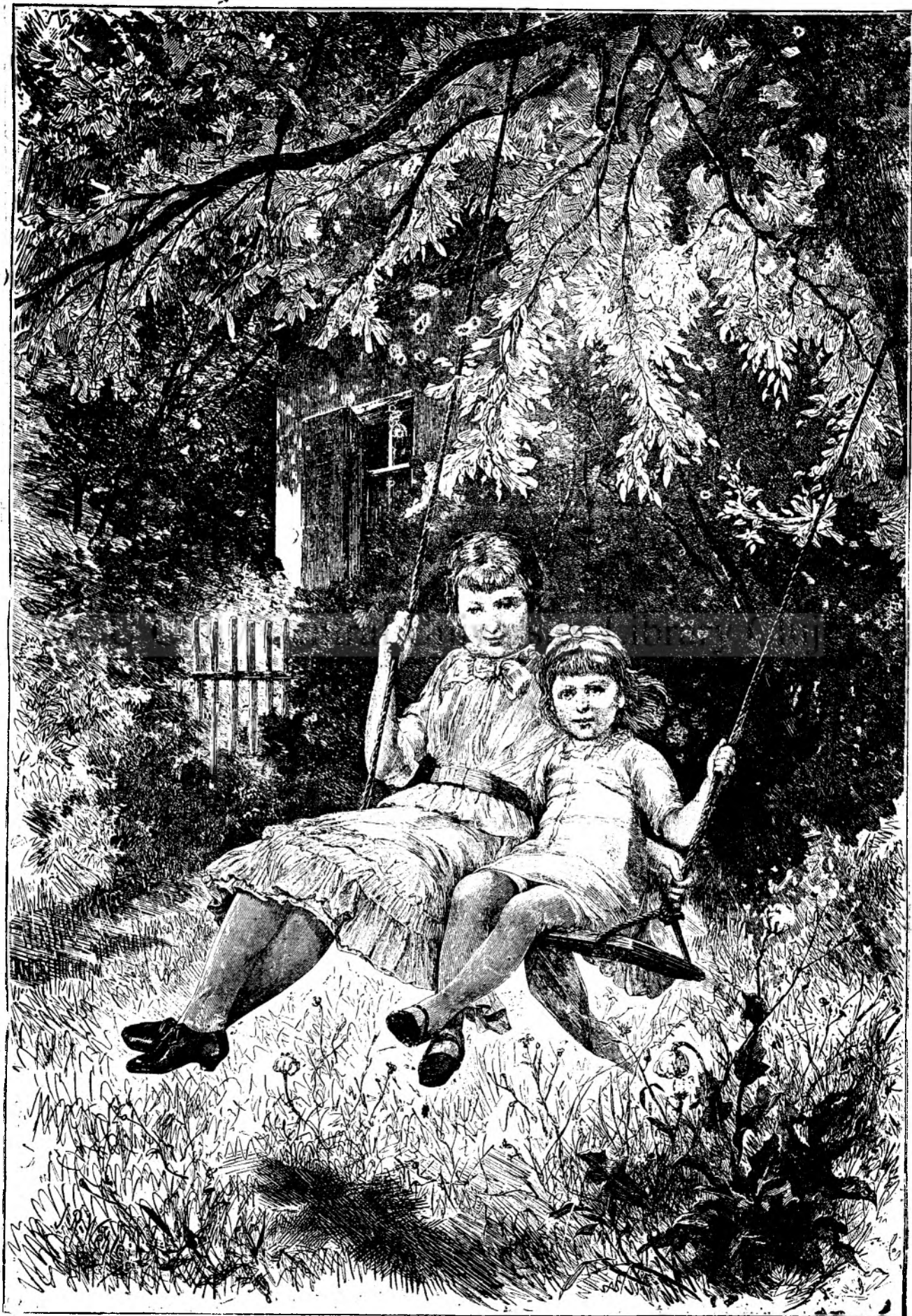
Plăceri în grădină.