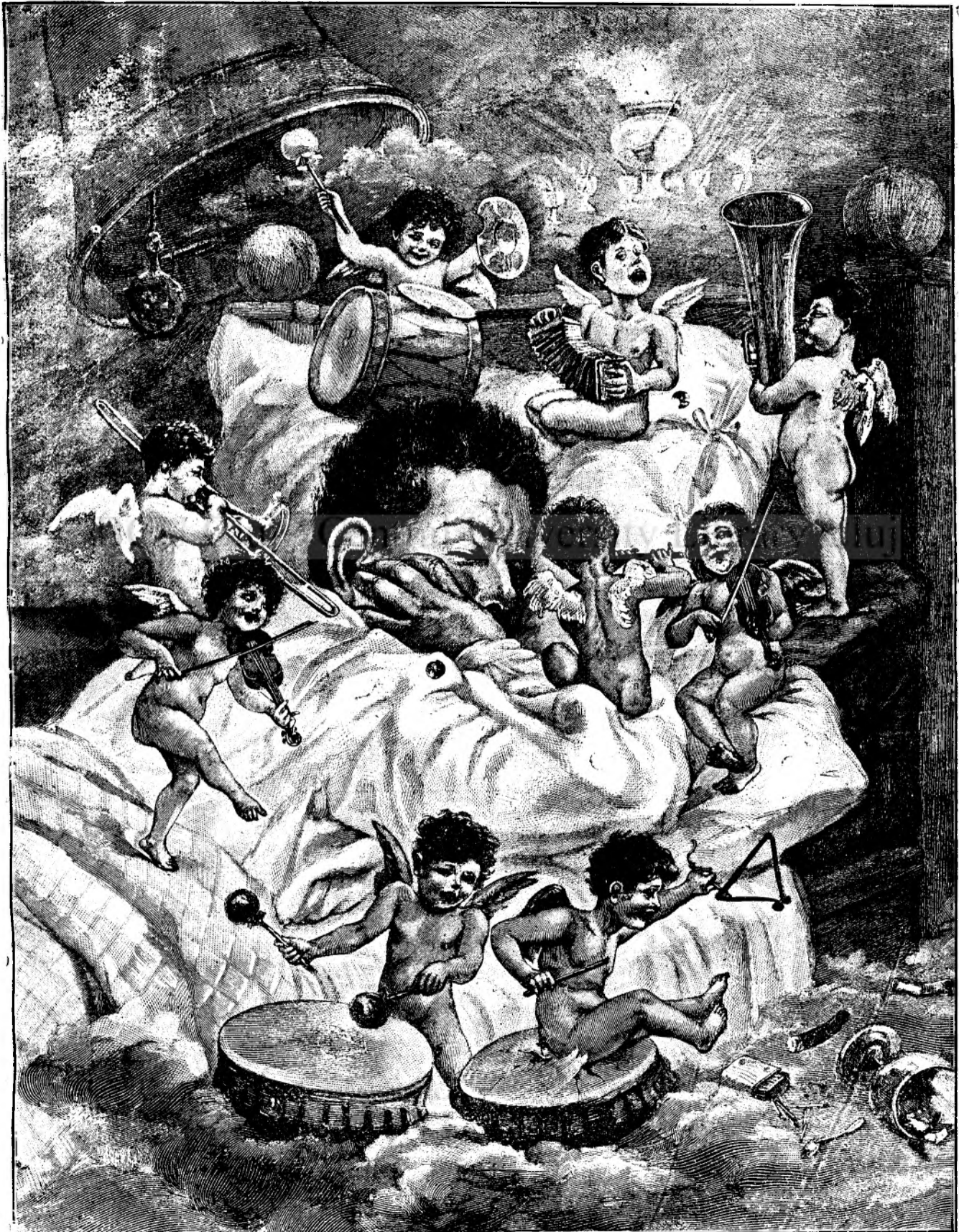
An nou fericit!