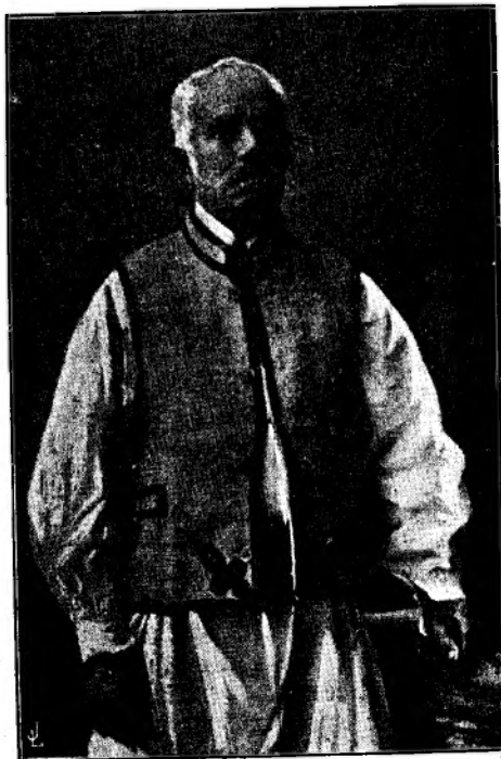
Un țeran din Băna.