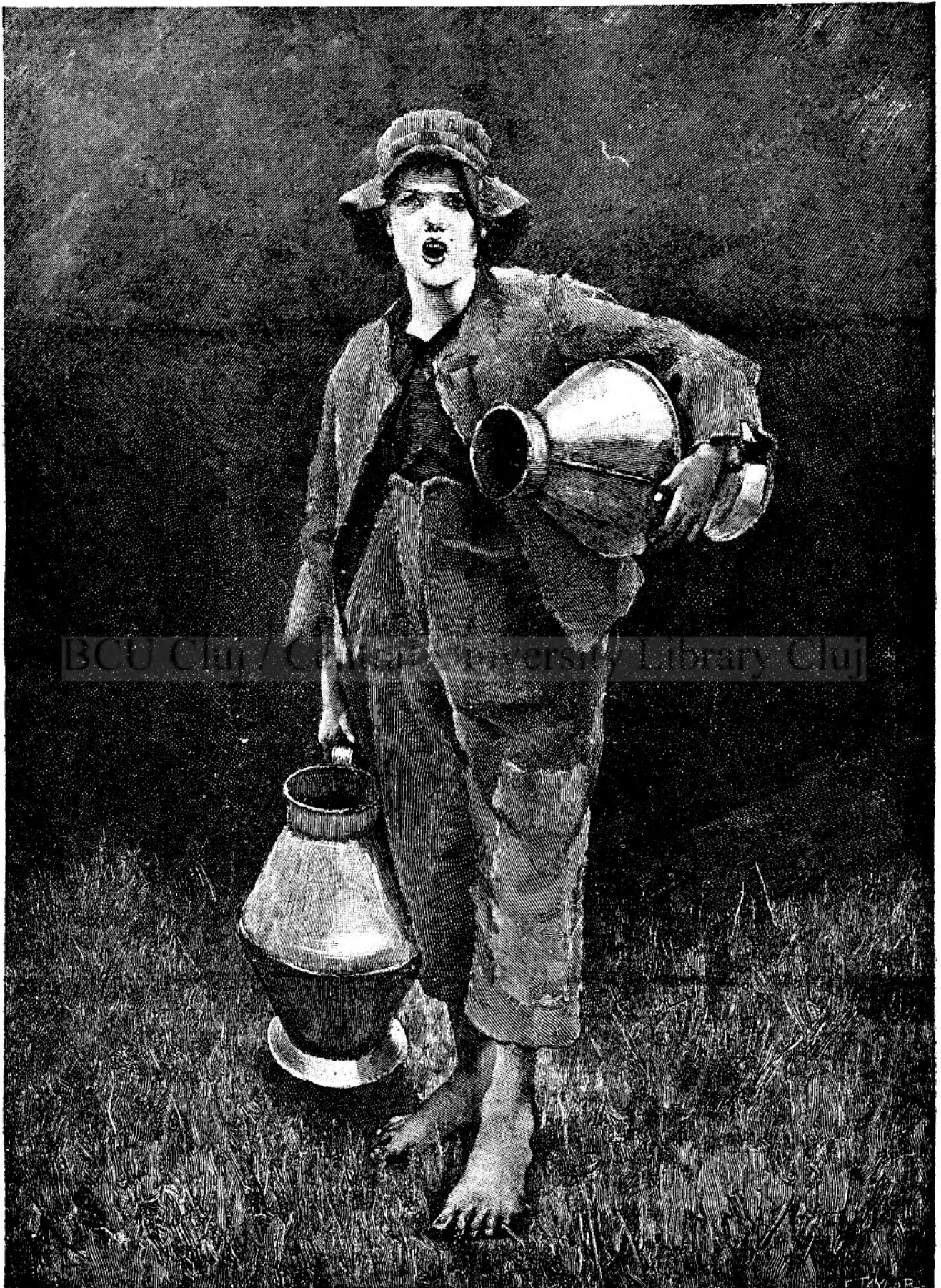
Vărsător de apă din Holandia