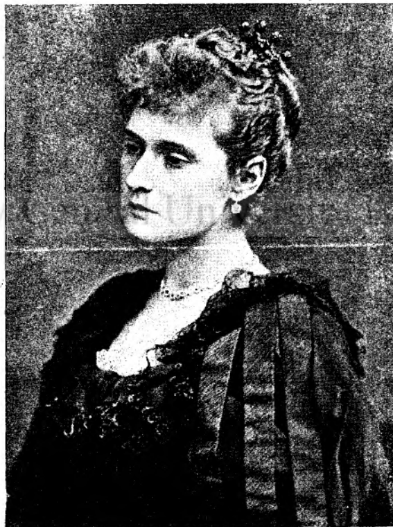
T a r i n a.

„Așa grăește Domnul! Toți călugării trebuie de-acuma înainte să se insoare, căci un bărbat ne-insurat e ca și un pom neroditor, care nu e bun de nimică alta, fără numai de tăiat și de aruncat în