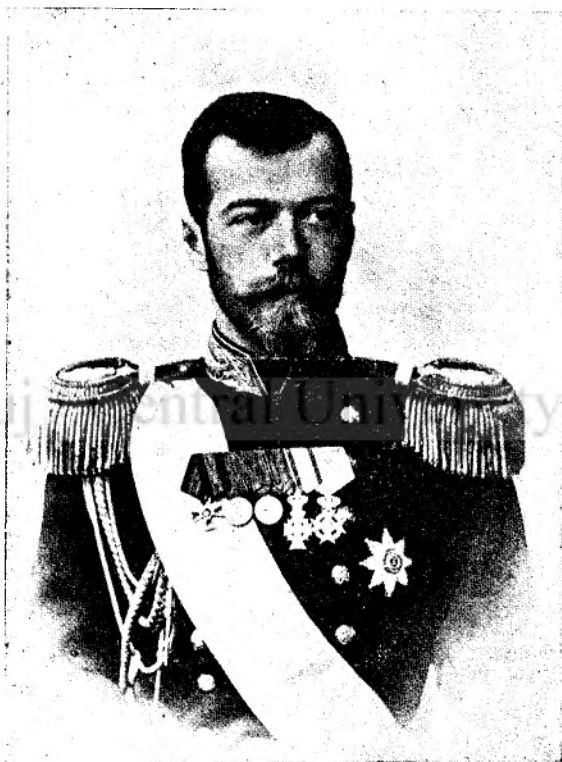
Ț a r u l.

Intr'o zi înse, prinzând Scaraoțchi de veste că dracul, ce-a voit să facă pe creștini ca să păcătuiască, nu i-a adus încă nici un singur suflet, s'a mâniat așa de tare pe dânsul, că puțin ce-a lipsit de nu l-a făcut hăbuc. A spus adică tuturor celorlalți draci ca să se stringă la un loc și apoi le-a poruncit ca să-l biciuiască cu biciuri de foc până ce nu va vedeai bine pentru că nu i-a împlinit porunca, ci a umblat numai... iac' așa... de frunza frâsinelului prin lume.