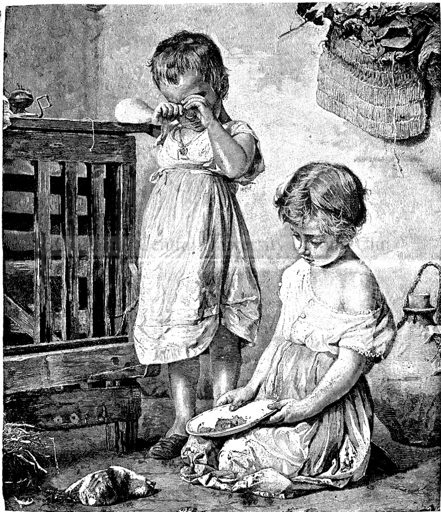
O jale adâncă.