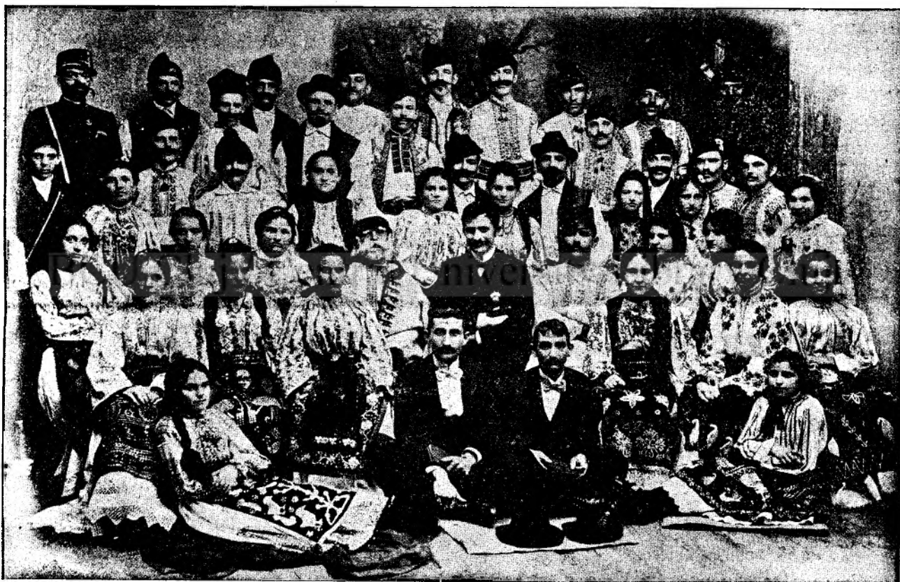
„Ruga dela Chiseteu“ jucată în Recița.

Călugărul Saschi, de câte ori ieșea pe ușa locuinței sale primitive, totdeauna își arunca privirea către poalele dealului. Când era timp limpede, de aici din nălțime ochii săi ageri puteau deosebi lămurit figurile ciobanilor cari plecau cu turma la pășune.