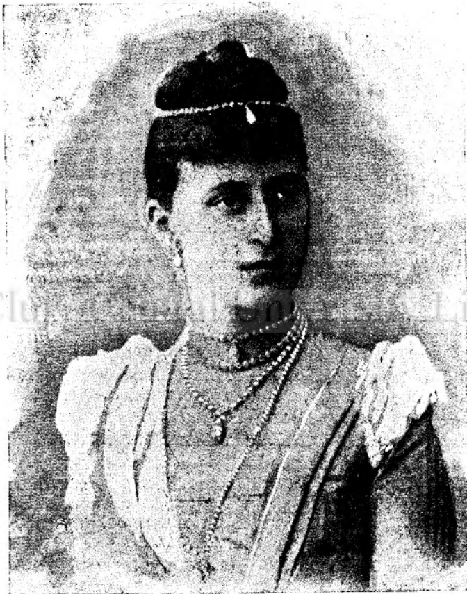
Soția marelui duce Sergius

— De pe tine se vede că n'o să fii dascăl. Bine și faci, fă-te domn mare. Numai nici popă să nu te faci, las' fie plătit cu mine. Dar pentru aia să te duci și de aci încolo la școală, numai să iei