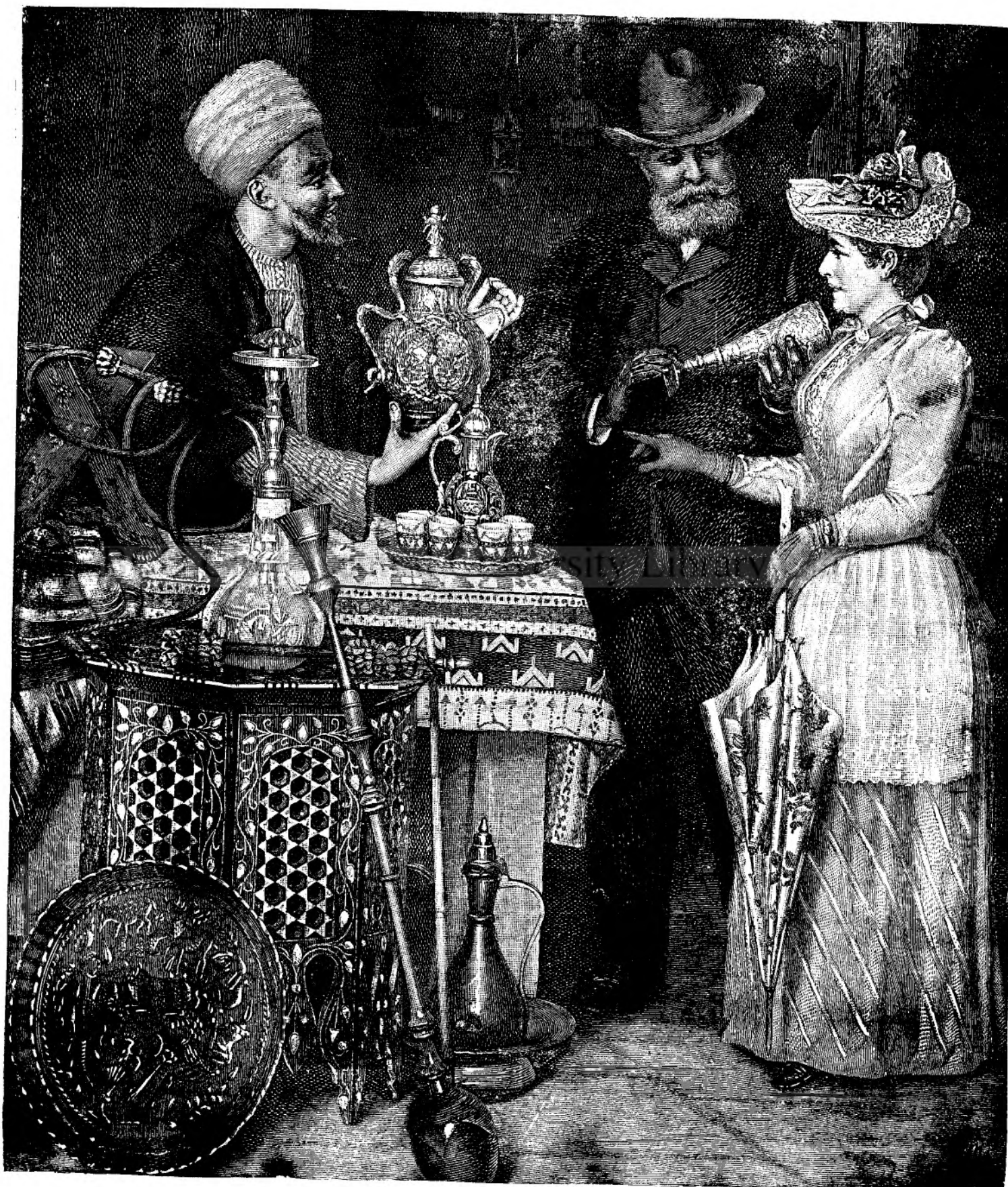
În bazarul din Constantinopol.]