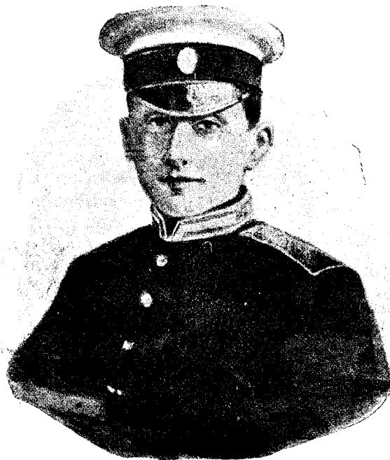
Prințul George moștenitorul Serbiei.

Dacă soartea vitreagă atât de greu a cercat provinciile din dreapta Dunării, cari, fiind mai aproape