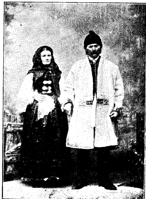
Români din Șiria.