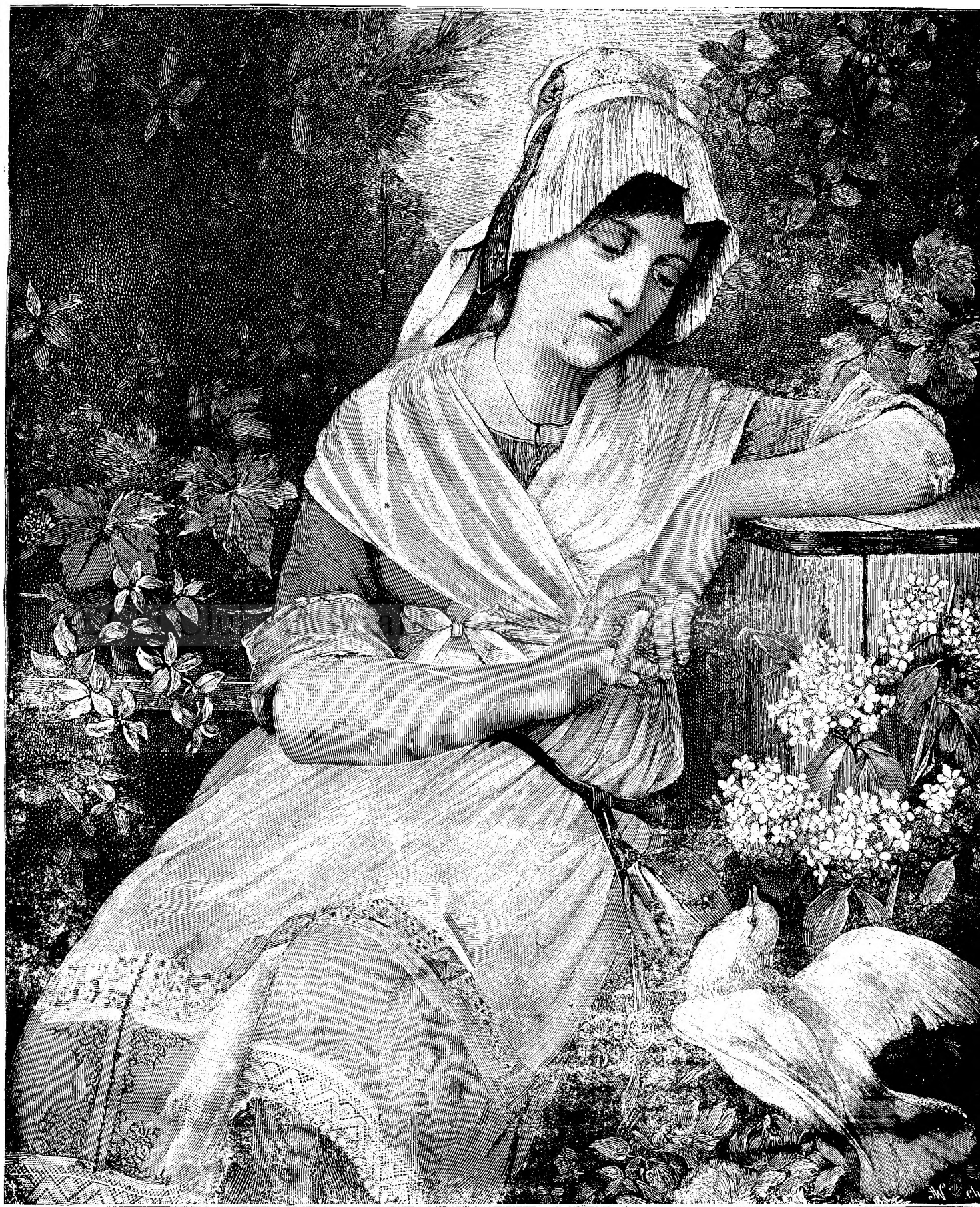
Vis de primăvară.