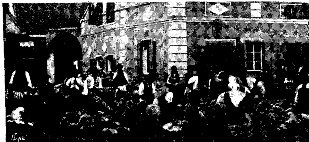
Tunsul oilor în Seliște.