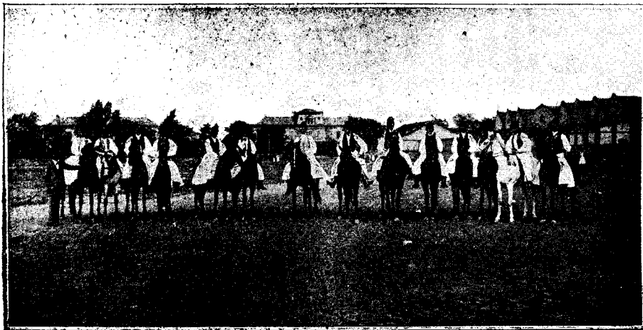
Grupă de călăreți din Bătănia.

țineau loc de zugrăveli, din geamuri două trei totdeauna sparte, după sobă îngrămădite câteva albături purtate ce așteptau mult până să vie spălătoreasa să le ia.