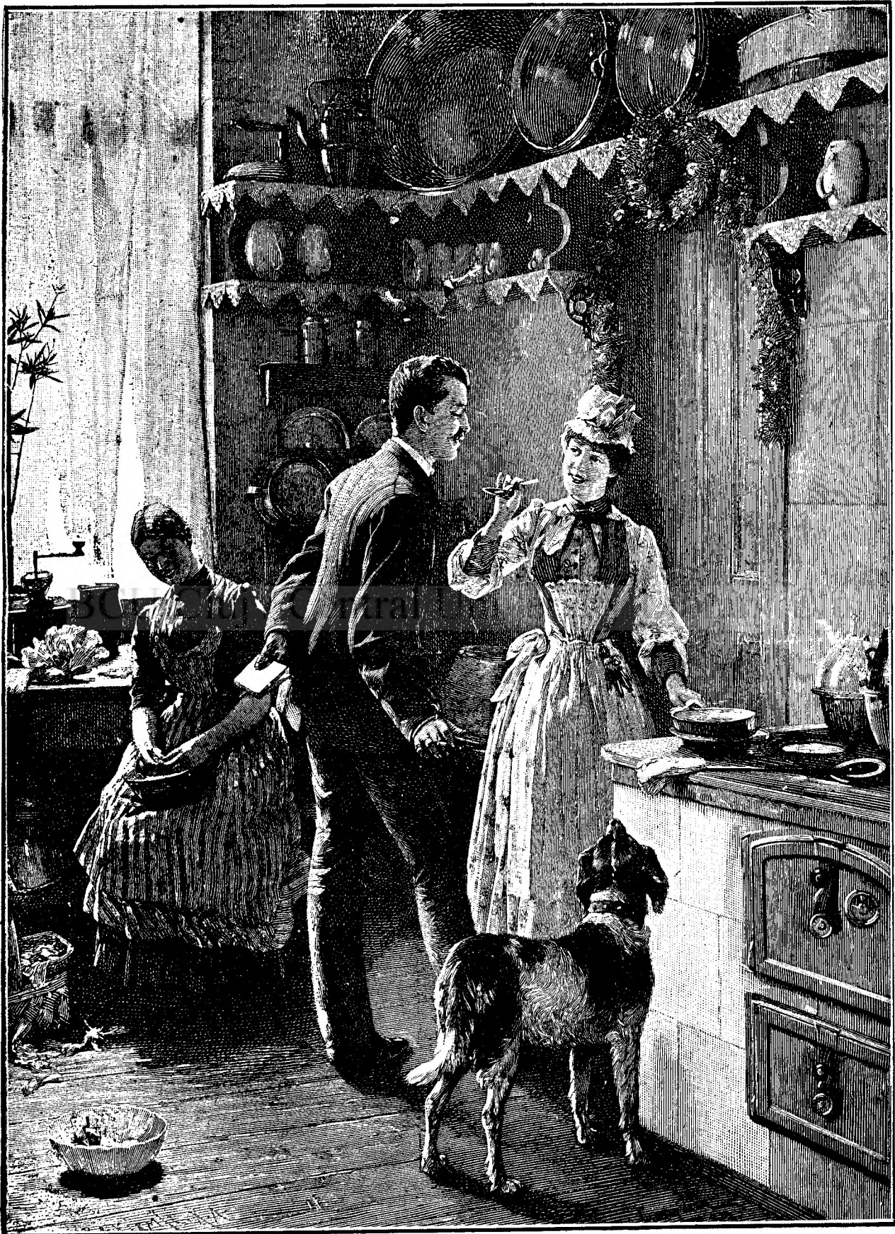
O vizită în bucătărie.