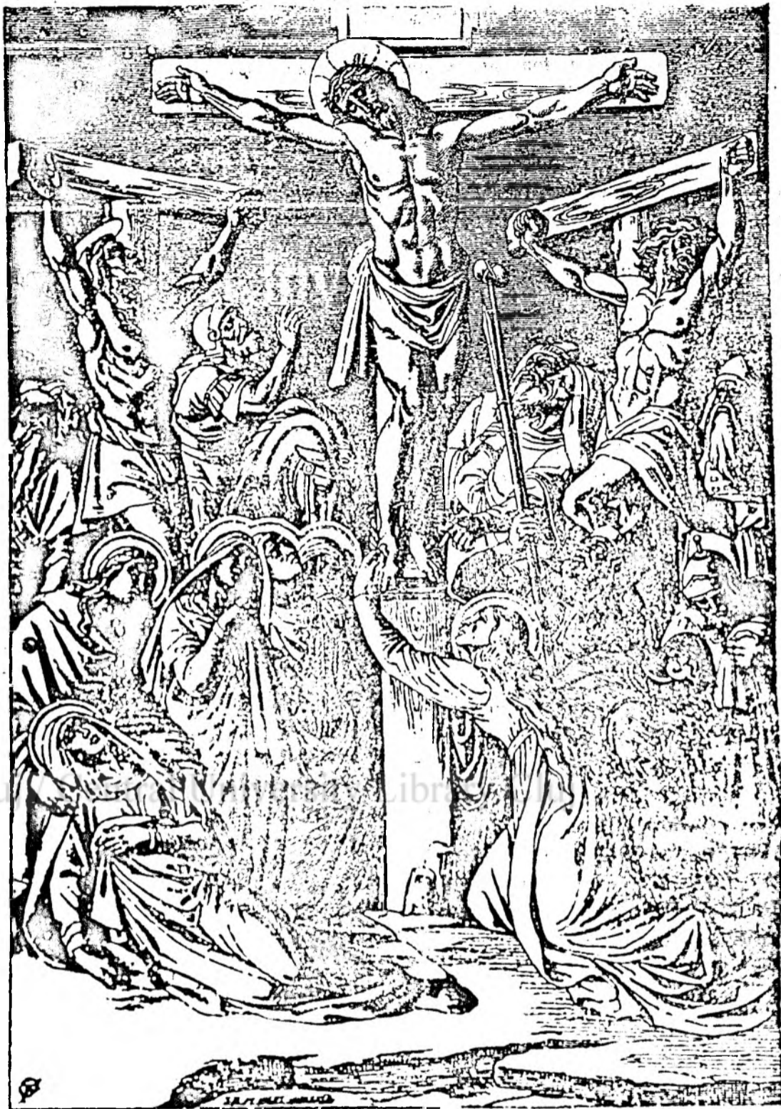
Răstignirea pe cruce.