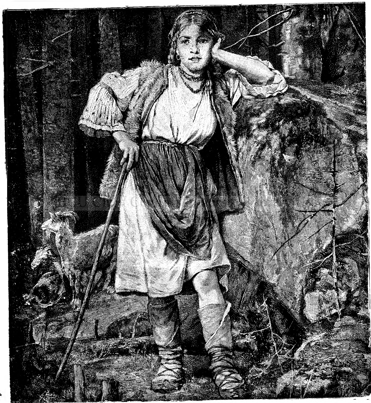
Ciobancă din Ardeal.