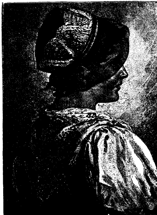
Fată din Schwarzwald.

Și acest ideal suprem omenesc este: o individualitate plastică prin o caracter nobil, prin o cultură sufletească superioară.