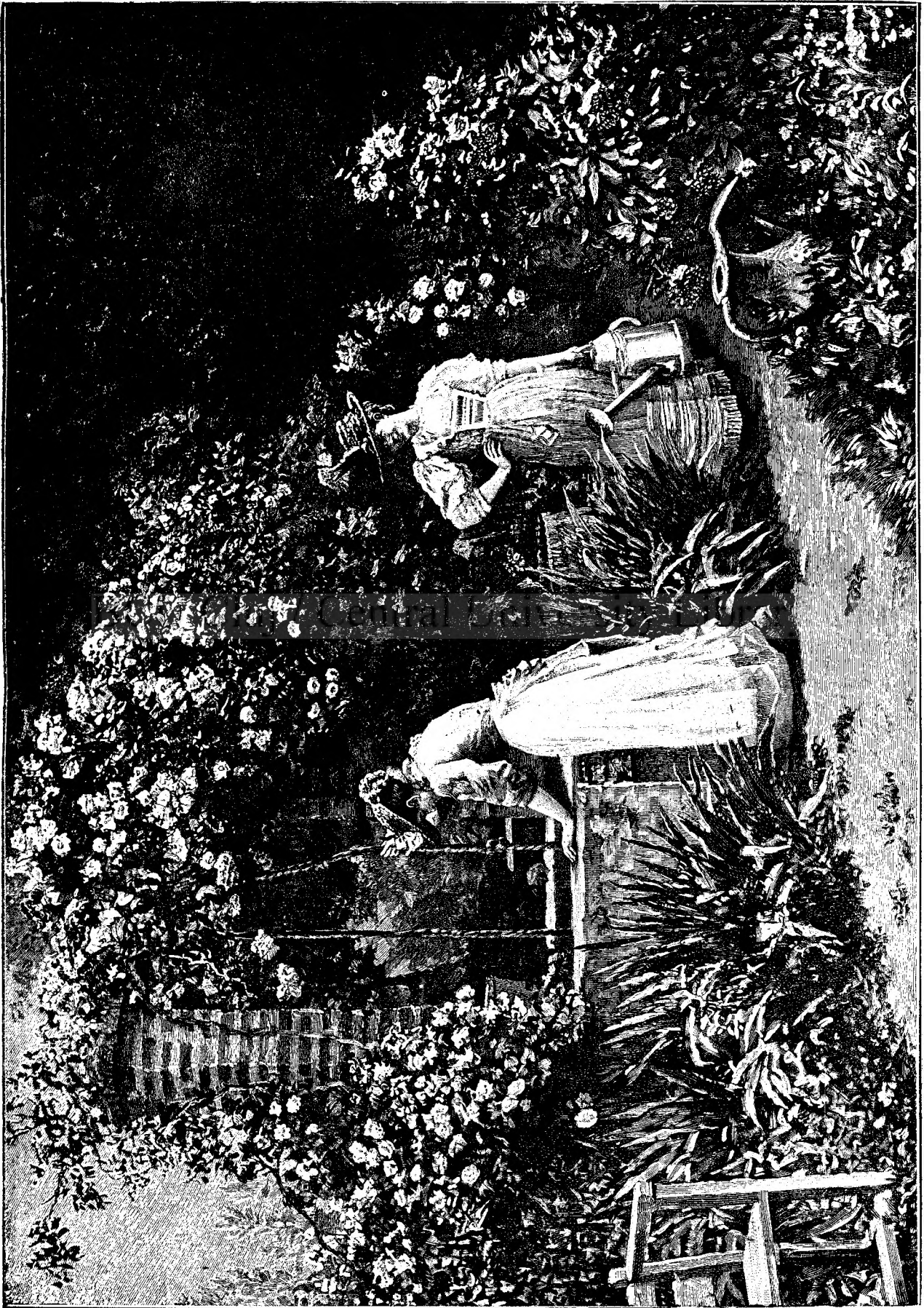
í n g r ä d i n ä .