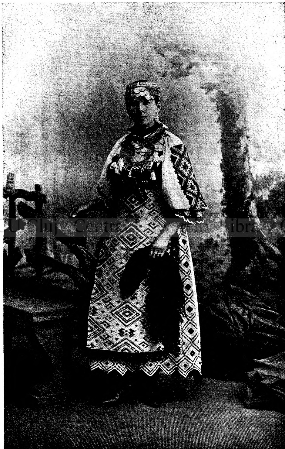
Româncă din Banat.