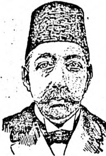
Sultanul Mohamed V al Turciei