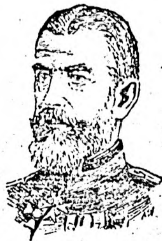
Regele Carol I al României