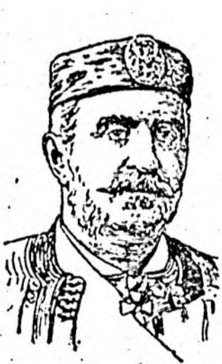
Regele Nicolae al Muntenegrului

Câteva chipuri dintre cele multe, cari împodobesc „Călimdarul Poporului“ pe anul 1913. — (Cetește și la pagina 11 a folii).