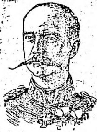
Regele George al Greciei