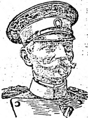
Regele Petru al Serbiei