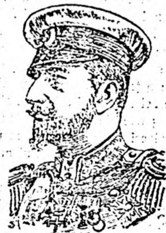
Regele Ferdinand al Bulgariei