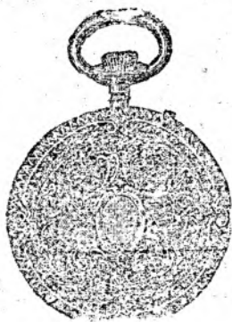
Nr. 4017 A