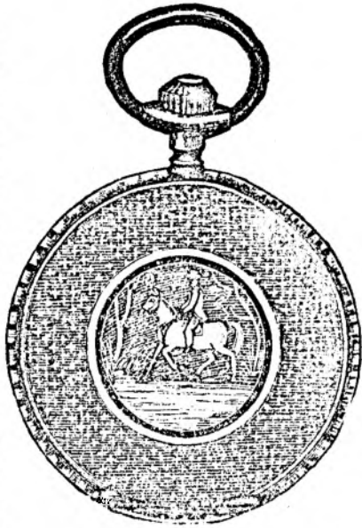
Nr. 160 F.