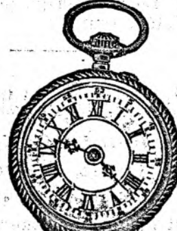
Nr. 128 A.

Orologiu de dame verit. de aur, 14 carate, foarte frumos fl. 20.75, același foarte taro fl. 27.50.