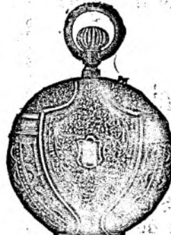
Nr. 196 A.

Orologiu de domni remon- toir de ruolz (Nensilber), cu 3 copereminte tari și frumoase, 50 mm., și esact fl. 4.50, același în calitate mai bună fl. 5.50, același de argint fl. 6.75, același de argint mai bun fl. 8.50.