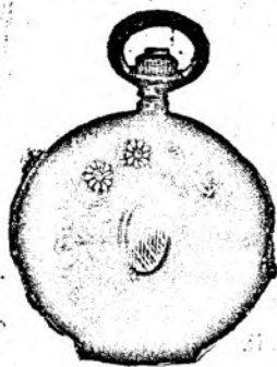
Nr. 194 A.

Orologiu de nichel remon- toir, 50 mm., calitate bună fl. 3.40, același de calitate mai bună fl. 4.10, același cu 3 copereminte tari fl. 4.40, același cu trei cope- reminte de calitate mai bună fl. 5.75.