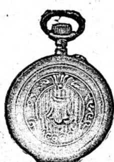
Nr. 187 A.

Orologiu de dame verit. de aur, 14 carate, 30 mm. diametru, frumos gravat, cu coperemint duple fl. 20.—, același în cali- tate mai bună fl. 30.—, același de argint fl. 7.50.