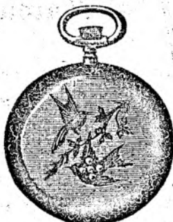
Nr. 200 A.

Orologiu de dame verit. de aur, 14 carate, 30 mm. diametru, frumos gravat, cu coperemint duple fl. 20.—, același în cali- tate mai bună fl. 30.—, același de argint fl. 7.50.