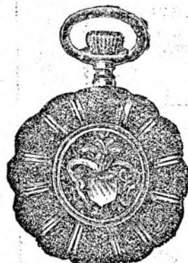
Nr. 6. Orologiu de dame, rem., de aur de 14 carate, 30 mm. diametru, capac dublu, I. calitate, guiloșat ori gravat fl. 25.—, în toc de argint fl. 11.50.