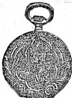
Nr. 5. Orologiu anker-remon. de argint, 50 mm. diametru, capac dublu, 3 capace de argint, 15 rubine, cu cerc de aur, fabricat fin, din sorte mai tari fl. 11.50, cu construcție cil.-rem. fl. 9.50.