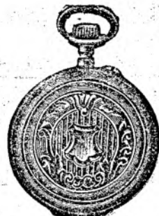
Nr. 7. Orologiu cilindru-remt. de argint nou, 48 mm. diametru, luciu ori gravat, în formă ovală, arătător de secunde, cu placă de cifre albă, emailată, I. calitate, fl. 4.50, cu capac dublu fl. 5.80. Lanțuri de nickel cu compas ori eșeiș 30, 40, 50, 60 cr.

Prospecte bogat ilustrate gratis și franco. Spedări cu rambursă ori pe lângă trimiterea înainte a prețului.