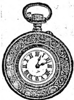
Nr. 3. Orologiu cilindru-rem. de argint, 48 mm. diametru, cu placă de cifre în email albă ori colorată cu toartă ovală, arătător de secunde, construcție bună solidă, fl. 6.75.