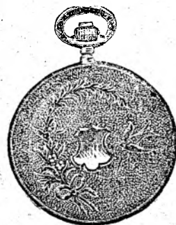
Nr. 2. Orologiu anker-remon. de argint, 50 mm. diametru, cu capac dublu, toc guiloșat ori gravat, 3 capace de argint, 5 rubine, sorte tari, I. fină „Uranawerk“ 15 rubine, fl. 12.50.