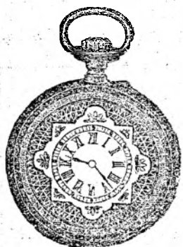
Nr. 1. Orologiu de argint remon-toir, pentru dame; 30 mm. diametru, cu capac de argint, calitate bună fl. 6.75, cu cerc de aur fl. 7.50, de oțel negru oxidat fl. 6.50.

Reparaturi de tot soiul se eșecută bine și conștientșos.