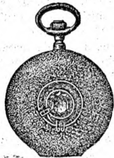
Nr. 7. Orologiu cilindru-remt. de argint nou, 48 mm. dia- metru, luciu ori gravat, în formă ovală, arătător de secunde, cu placă de cifre albă, emailată, I. calitate, fl. 4.50, cu capac dublu fl. 5.80. Lanțuri de nik- kel cu compas ori cheia 30, 40, 50, 60 cr.

Prospecte bogat ilustrate gratis și franco. Spedări cu rambursă ori pe lângă trimiterea înainte a prețului.