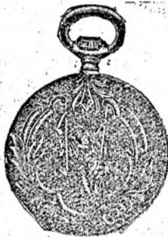
Nr. 4. Orologiu cil.-rem de argint, 48 mm. diametru, cu capac dublu, în toc gravat frumos, sorte tari, I. fabricat fin fl. 8.75.