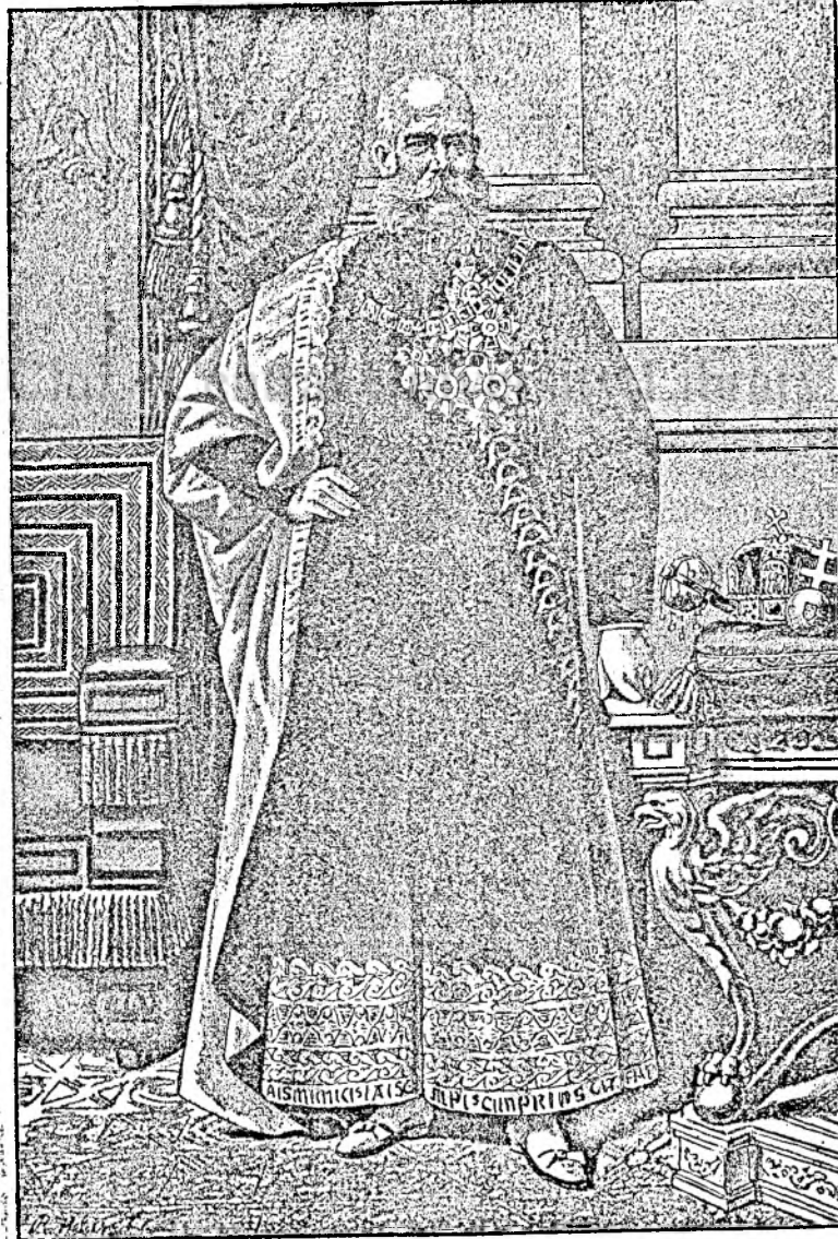
FRANCISCI IOSIF I.

În ziua de Anul-Nou umbla 'Fasolea' urînd oamenilor noroc și sănătate. În carnaval, cășlegi ori 'fârșang', cum îl numiți, aveți petrecerile voastre frumoase românești, la cari jucați românește câte-o întorsătură, bătătoră, mînați ca o moară de arcușul cu foc al Țiganului dela Oarda-țiglarie.