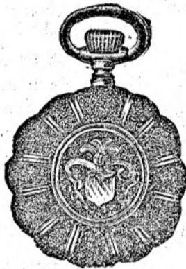
Nr. 5. Orologiu anker-remon. de argint, 50 mm. diametru, capac dublu, 3 capace de argint, 15 ru- bine, cu cerc de aur, fabricat fin, din sorte mai tari fl. 11.50, cu construcție cil.-rem. fl. 9.50.