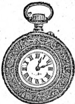
Nr. 3. Orologiu cilindru-em. de argint, 48 m.m. diametru, cu placă de cifre în email albă ori colorată cu toartă ovală, arătător de secunde, construcție bună so- lidă, fl. 6.75.