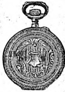
Nr. 6. Orologiu de dame, rem., de aur de 14 carate, 30 mm. dia- metru, capac dublu, I. calitate, guiloșat ori gravat fl. 25.—, în toc de argint fl. 11.50.