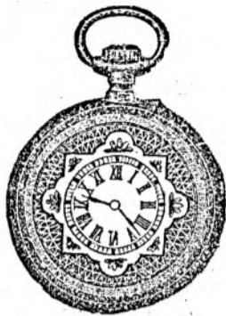
Nr. 1. Orologiu de argint remon- toir, pentru dame; 30 mm. diametru, cu capac de argint, calitate bună fl. 6.75, cu cerc de aur fl. 7.50, de oțel negru oxidat fl. 6.50.

Reparaturi de tot soiul se execută bine și conștientios.