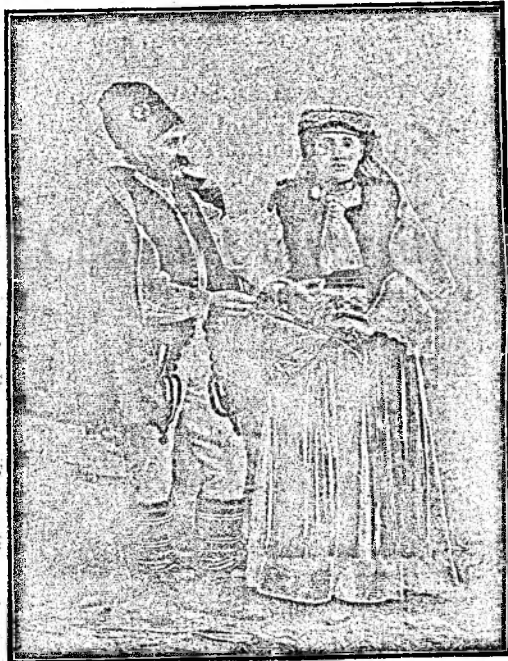
Români din Bănat.