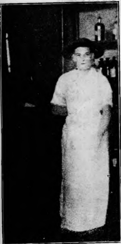
Doriți un pahar cu whisky sau... o sticlucă cu morfină?

Un accident de automobil stupid cu ceva radiatoare sfărâmate și victime omeneste — a pus, nu de mult, autoritățile pe urmele unei afaceri incurcate și nedorite. Mai cu seamă nedorite. Fiindcă unele afaceri, prin natura și prin mediul lor — pun în situații neplăcute nu numai pe anchetați dar și pe anchetatori. S'ar putea spune, chiar, că neplăcerile cad mai mult pe capul anchetatorilor. Replica faimoasă din „Viceniile lui Scapin” — „Ce dracu căuta în corabie?” e foarte cunoscută cu deosebire la poliție.