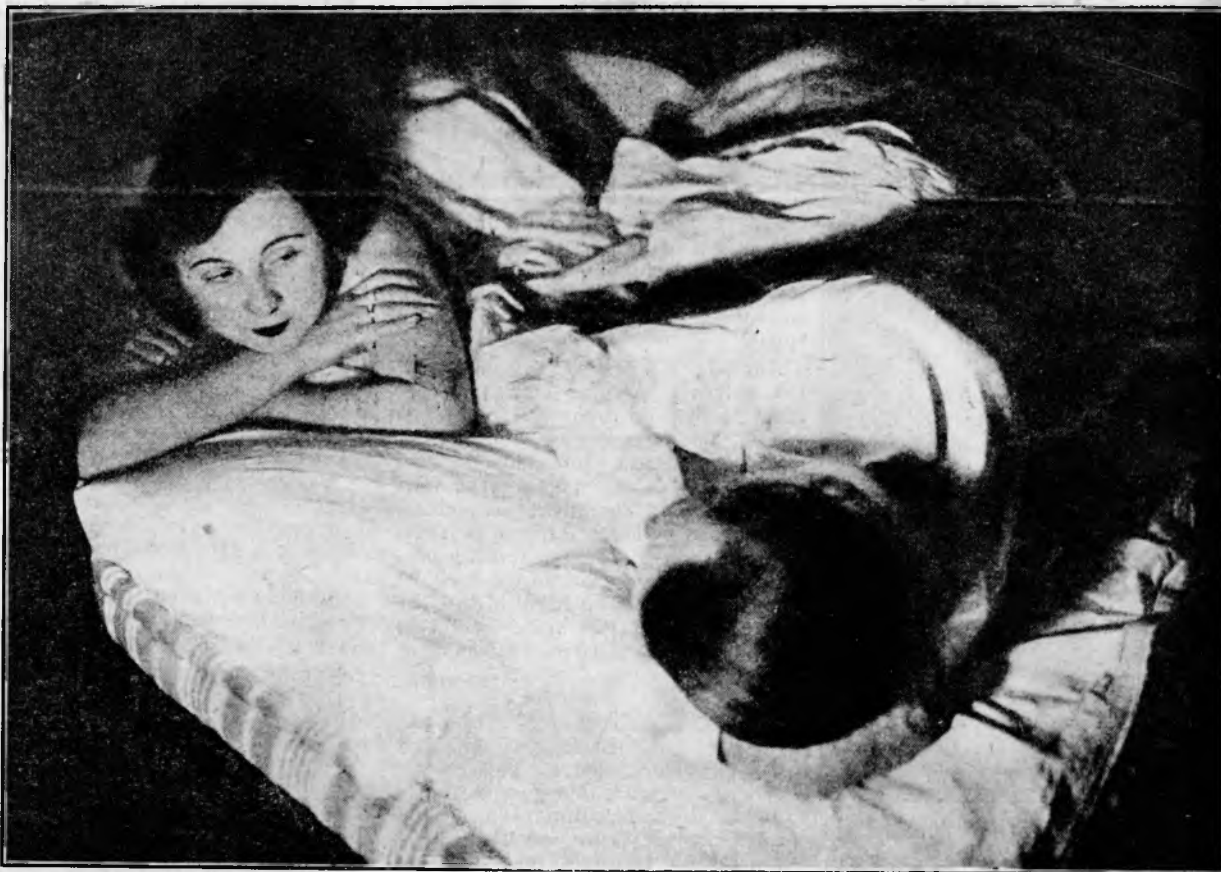
Doi parteneri... in beția morfinei