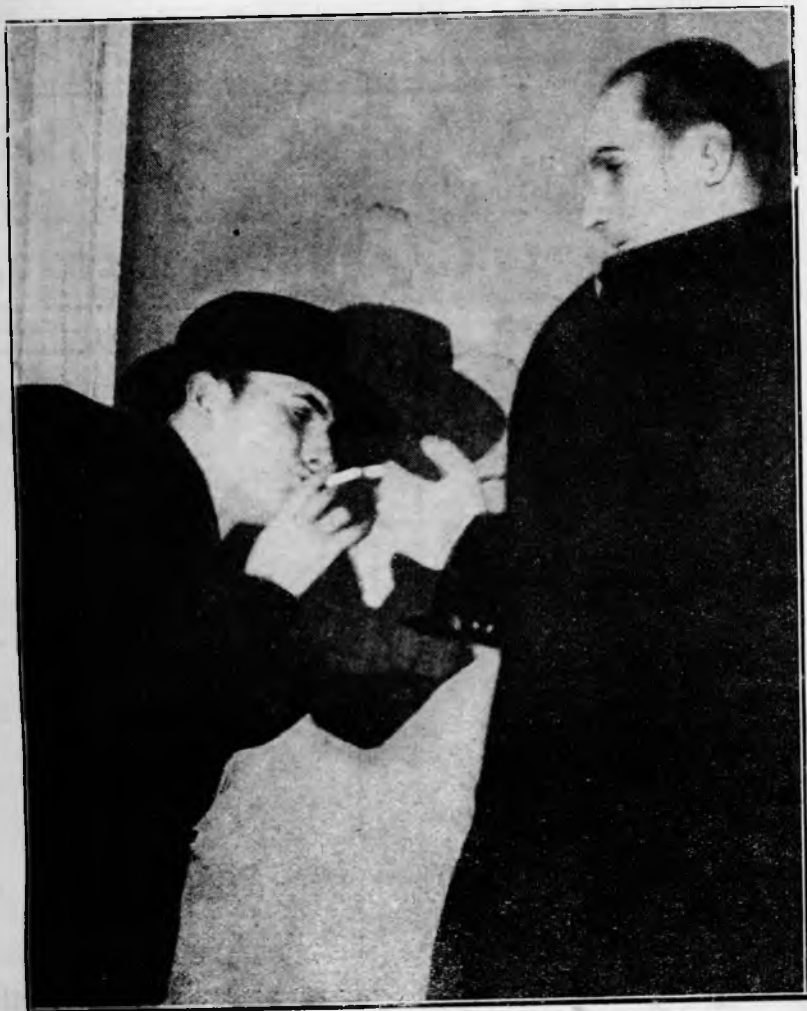
Intre traficanții de stupefiante

De cinci ani — la patru luni după căsătorie — soția sa căuta în morfină înlăturarea unor nemulțumiri intime. Deosebirea mare de vârstă