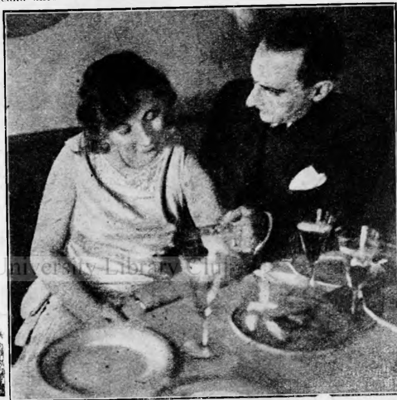
— „Luați o priză, frumoasă doamnă?”

— Domnule? Ce i-ai făcut domnule? De-abia se liniștise. Las'o te rog! Vine „domnu doctor” și-mi găsesse beleaua.