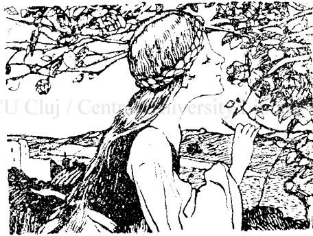
Tip. ASTRA s. a. · Cluj, str Regina Maria 4