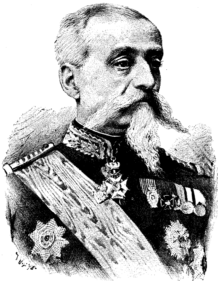
Generalul I. E. Florescu, ministrul-president al României.

Cea dintîu și cea mai importantă condiție este, ca să fie înzestrați cu numeroase rădăcini proaspete, sănătoase, lungi și cât mai puternice. O cerință neapărată sînt rădăcinile subțirele, cunoscute sub numele de ațoase, care ele absorb din pămînt sucul nutritiv; în lipsa totală de rădăcini ațoase, pomii nu se prind sau apoi tînjesc ca vai de ei. Antîietate se cuvine pomilor, a căror rădăcini se întind mai mult în laturi, decît în jos. Decât earși rădăcini puține și groase, mai bine multe și subțiri.