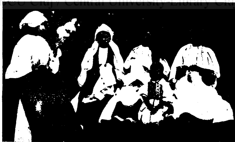
Noi ținem Joile.