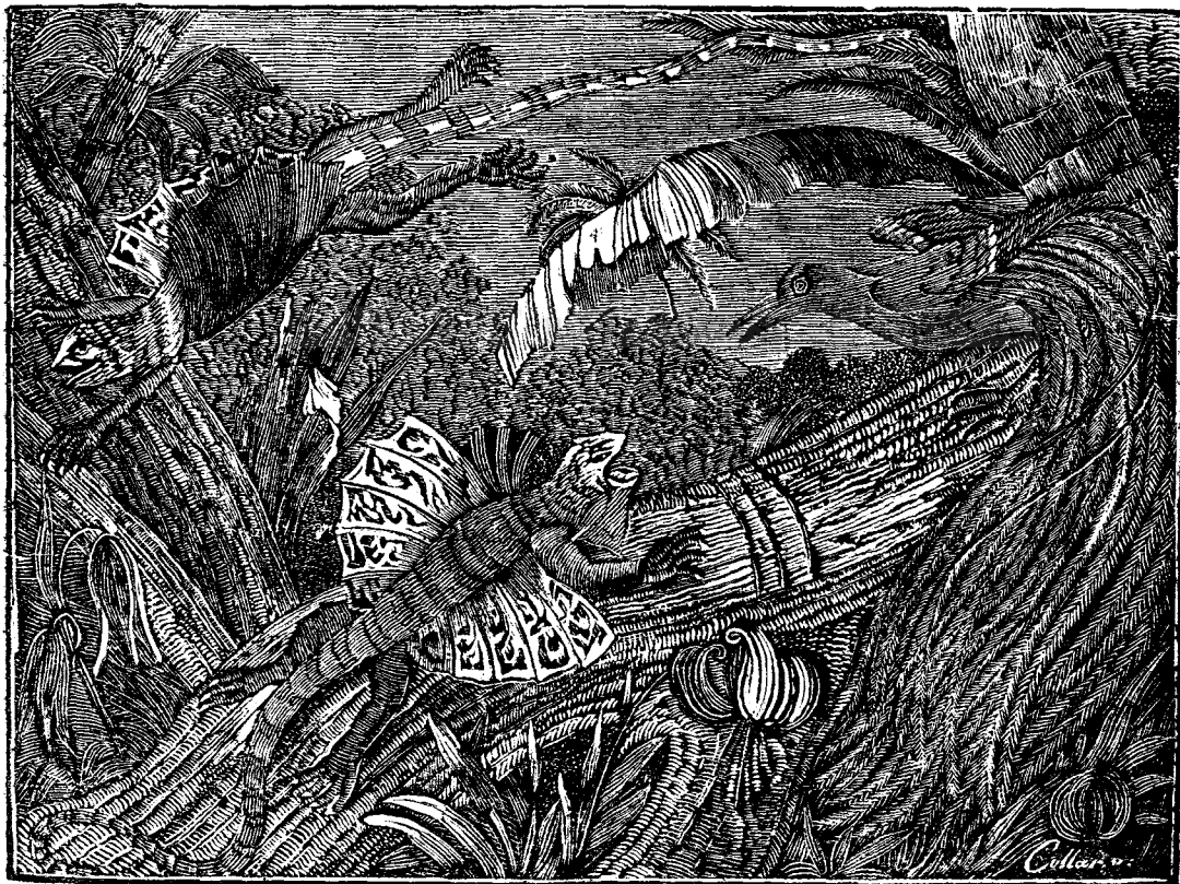
Парадісеа саЪ Пажора ші Іасіліскѣла.

ЦІРЕ СЪПЪТЪРЪ ДОЛО ФЪПЪТЪРІ ДЕ ДІХАНІЙ, КАРЕ ОАІНІОАРЪ АР ФІ ФОСТ КЪ АДЕВЪРАТ, НЪМАЙ А ДЪМЪ ФАБЪЛАЛОР СЪ АРАТЪ, А- ДЕКЪ: ПРЕ ПАЖОРА ШІ ПРЕ ІАСІЛІСКЪЛА АЪ КІП САЪ ФОСТ ОБІЧЪІТ А ПОВЕСТИ ДЕ ТОА- ЧЕ АЧЪКЪТЪ, ЧЕ НЪ СЪ ПЪТЪ КЪНОАЦЕ А- ТЪРЪ АДЕВЪРЪ, ШІ СЪ АТРЕВЪІНЦА КЪ НІЦЕ ІСТОРИЙ МІНЪНАТЕ ШІ ФАБЪЛОЪЕ; АША ШІ СЪКРІІТОРИЙ ІСТОРИАЛОР ФІРЕЦІ МАЙ ВЪРТОС ДЕСРЕ АЧЕСТЪ ДОЛО ДІХАНІЙ, ПРЕ КАРЕ ЄІ АКЪ НЪ АЪЪ ФОСТ ВЪЗЪТ, ДЕЪТЪЛА ДЕ КІНЕ