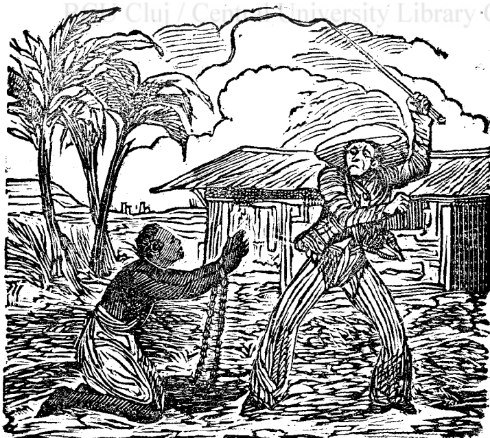
П е д ѣ п с а Р о к і л о р .

Інсола С. Коікс, ар Къпїтанъа аѣ порън- чїт ѣнѣ Негър тѣнър, съ съ сѣе а вър- ѣѣ Картагълаѣ съ ѣ стѣгъла жос, шї кѣнѣ лаѣ дезлегат ш'аѣ пїераѣт цїнерѣ шї аѣ кѣзѣт а Маре. Аѣ стрїгат сѣї дѣ а- жѣторїѣ, дар немїлостївѣла Къпїтан н'аѣ врѣт съ трїміцъ Чїнѣла, сѣла скоацъ дїм