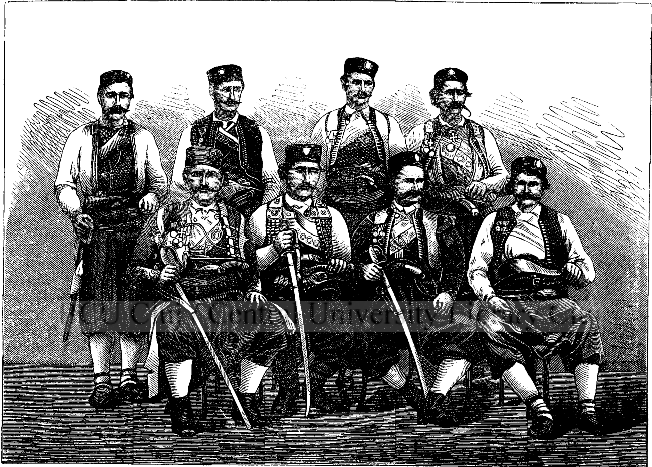
Muntenegrenii. (Pag. 57.)

Însușirile războinice și neîntreruptele războaie cu Turcii n'au permis Muntenegrenilor, să éșă cu totul din starea de barbariă, ba putem dice, de sălbătăciă. Împregiurările