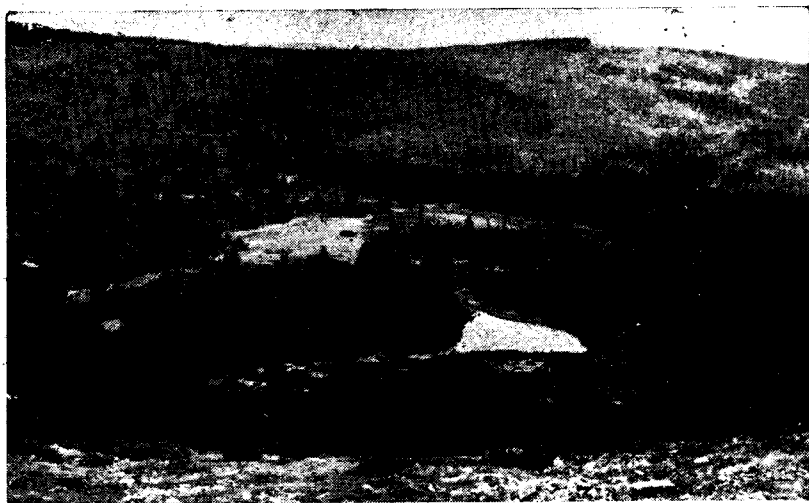
A Tengerszem tava és hajdani gleccser völgye a Csáky-csúcs oldaláról nézve. A háttérben a Szádeczky-csúcs képezi.

Közvetlenül előttünk a bélbóri és rakottyási, távolabb a Szék-pataki és borszéki medencék lapos tálacskái mélyednek bele a lankás, dombos térszínbe. Ezek már nem tűzhányók termékei és sokkal, sokkal öregebbek, sok millió éves kristályos palából vannak felépítve. A medencékben pedig épúgy mint a héviziben, valamikor tavak vize hullámozott, amelyik lassan eltözegeedett. Ennek tanuja a sok szénréteg, ami a tavakat feltöltő fiatal rétegek között található. A látóhatár szegélyét a Nagybagmász, a Gyilkos-kő, Kis- és Nagy Békás mészkő szirtjei csipkézik. Moldovából átnéz a határon a Csalhó és a Tarkó hasonlóan festői mészkő tömege. Késő délutánig eltá-nyázunk ezen a pompás kilátó ponton, hol a Kelemen csoportját, hol a Gyergyói havasok panorámáját bámulva. Késő délutánra lassan leereszke-dünk a Vízvásztó gerinc 1375-ös pontjáról a Szekeres patak völgyébe. Itt már újra csak a ripacsos kövek, tűzhányók köpködté tömkelege fogad.