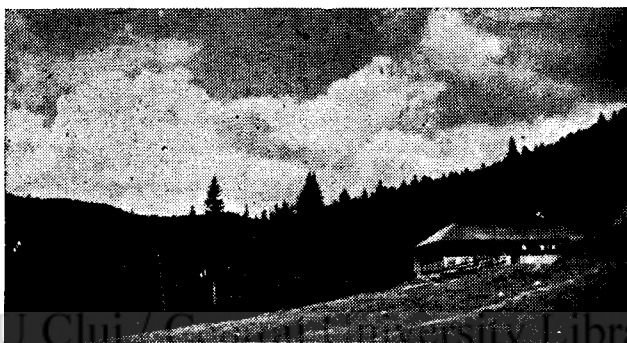
* A Mingyet-völgyi menedékház.

Szépségével mindenkit megfog, akit útja erre vezet. Erről a felső rétről tekintsünk vissza az Arcserra. Nehéz innen elválni annak, aki a szépet szereti s azért a lefelé vezető út rendszerint nem sokkal rövidebb ideig tart, mert sokszor kell visszanézni azokra a helyekre, ahonnan lejutottunk. A kis réten lefelé haladva, a nagy rétre jutunk (1350 m) és ezt keresztezve, a lomberdőt érjük el. Itt a legjobb taposott ösvényt kell választanunk, mely az erdőn keresztül levezet a Grohot meredekéig (1268 m). Ennek kerengőit követve, lejutunk a kiindulási pontunkra, ahhoz a kőtörmelékkúphoz, melynél a két út találkozik. A nagy rétről való meredek leereszkedés mindenesetre megviseli a térdeket, de a menedékházig való enyhe lejtőjű lemenetelkor kipihenhetjük a fáradságot. Ha pedig lejövetkor a házhoz közel a patak összefolyásánál lévő mélyebb vízben megfürdünk, teljesen pihentnek érezzük magunkat.