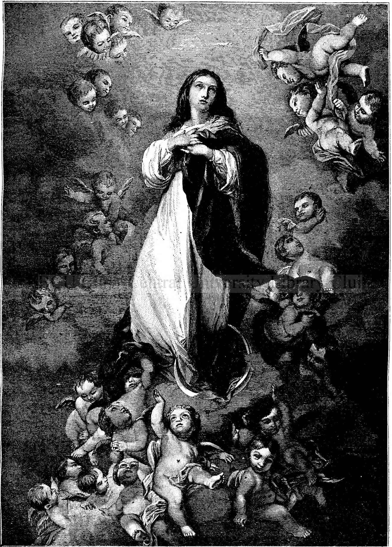
MADONNA DE MURILLO.