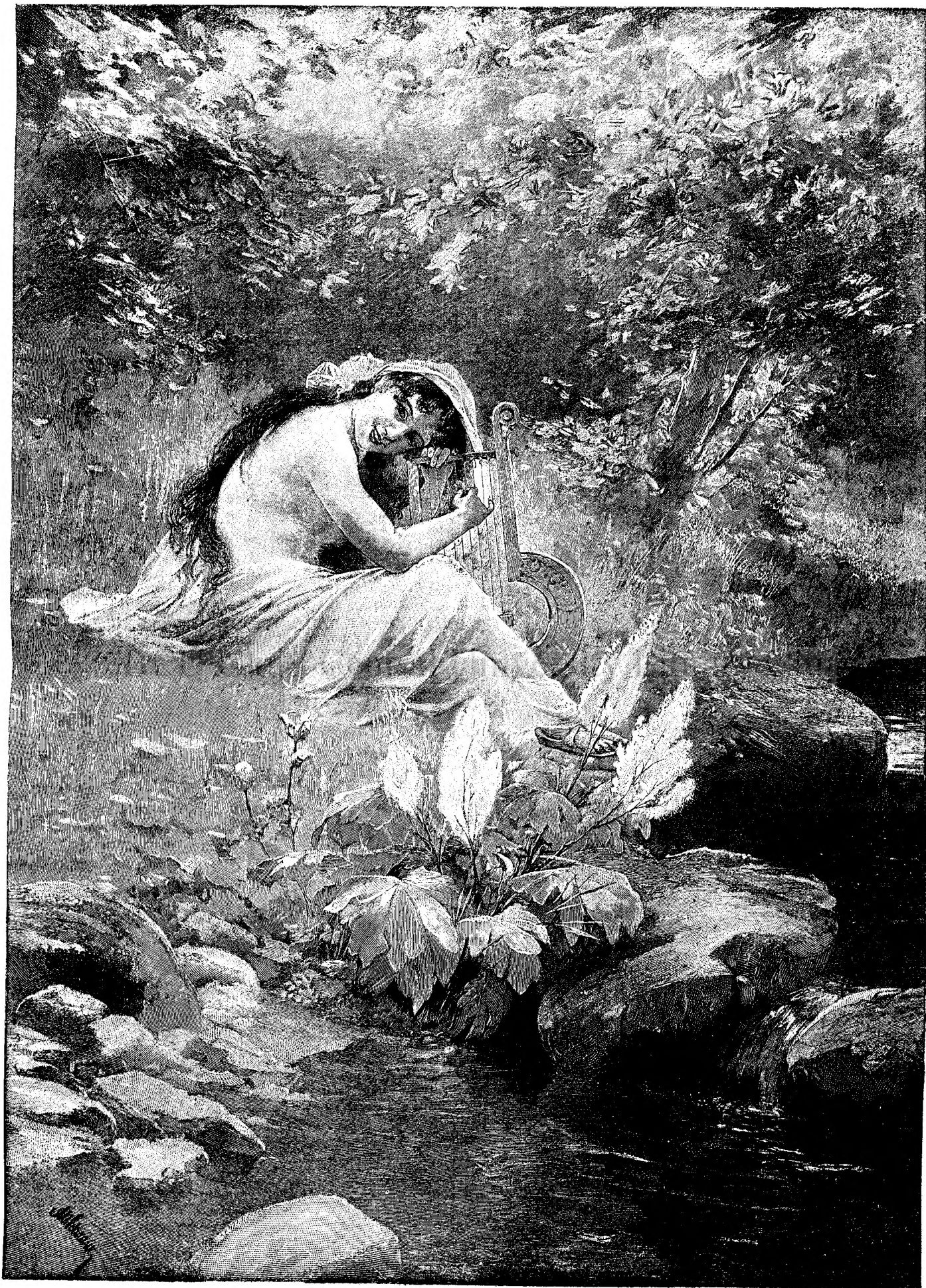
E C H O.