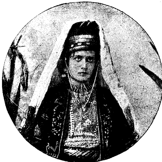
FATĂ DIN BETLEHEM.

Fruntea orașului, partea liniștită și frumoasă a Galașilor, se desfășură 'n sus, de-asupra portului, pe podișul ridicat între Siret și Prut. Nimic nu-ți mai amintește timpurile de groază și de jaf prin care-a trecut orașul acesta mare și plin de viață. Case vechi, cu ziduri groase și drepte, văruipe pe dinafară, cu obloane la ferestre, și cu balcoane ruginite de care-aternă vrejuri uscate de ederă, aș aerul unor bē-