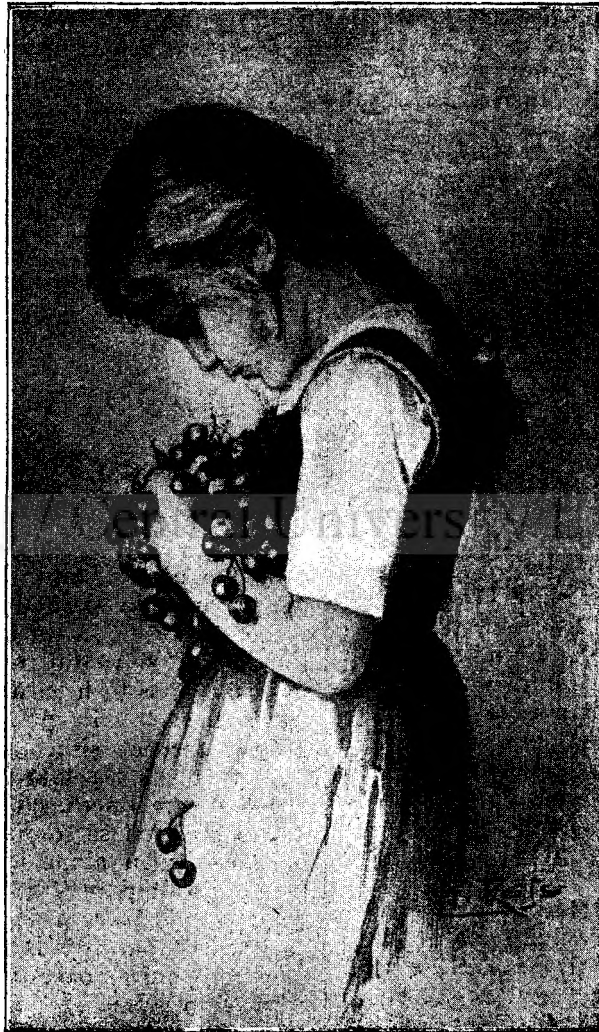
C i r e ș e .

„Te bolnăvește iubirea mea? — dîse el la a-