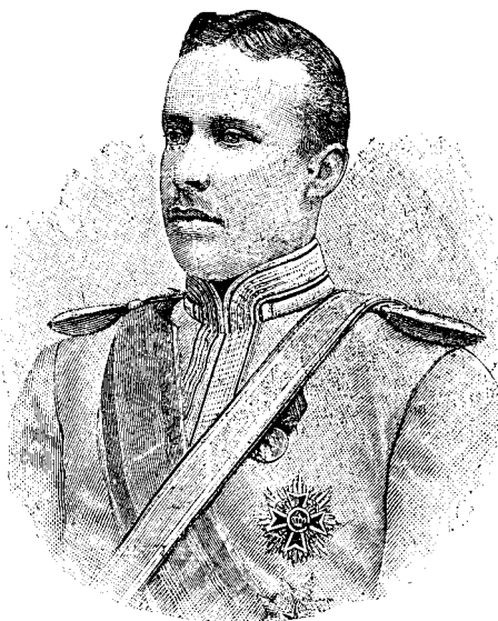
VILHELM PRINCIPE DE WIED.

„Să compunem undeva un comitet de bărbați de