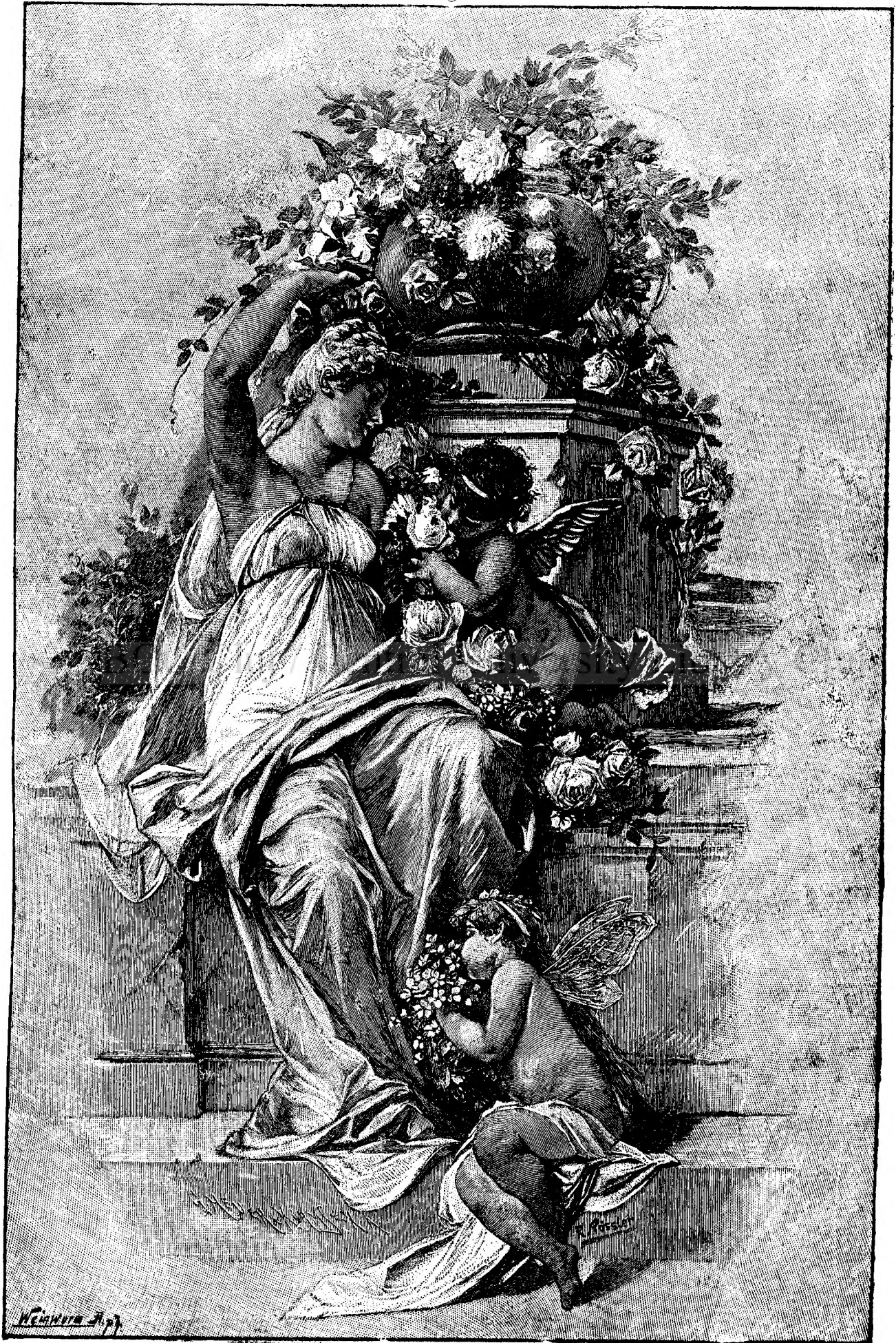
M I R O S U L.