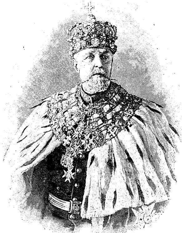
OSCAR II REGELE SVEDIUL.

Merge necăjit acasă. Ia scrisorile ei din pulpit, — sunt albe și colorate și respândesc un miros amețitor. Le mai citește încă odată, e de ultima