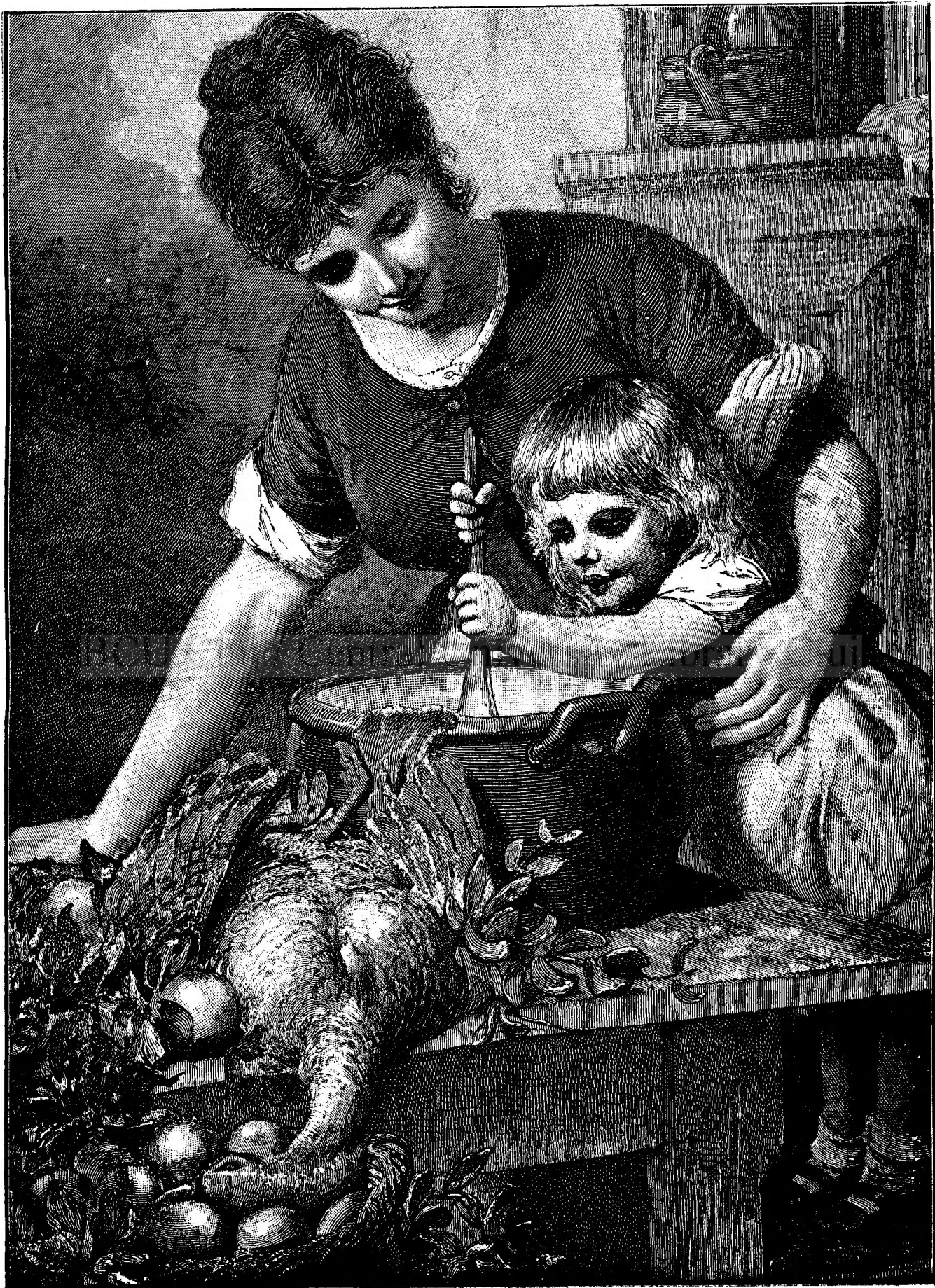
V I N S E R B Ă T O R I L E .