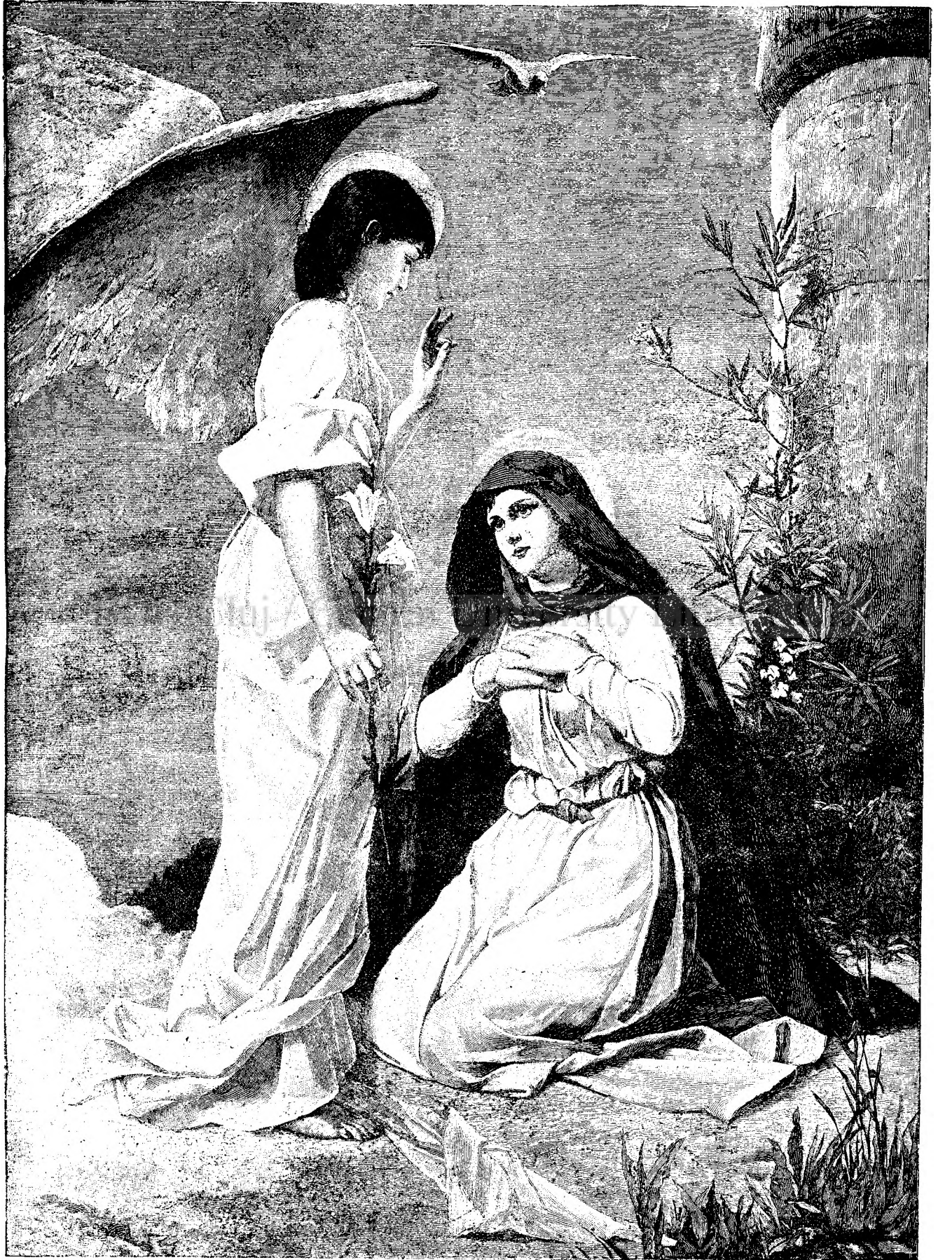
A V E M A R I A !