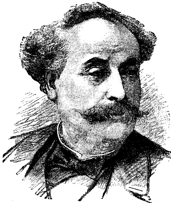
ALESANDRU DUMAS FILS.

A scris apoi o serie lungă de piese: Diane de Lys (1853;) La demi-monde (1855;) La question d'argent (1857); Le fils naturel (1858); Une père prodigue (1859); L'ami des femmes (1864); Le supplice d'une femme (1865), in colaborațiune cu Girardin; Les idées de Madame Aubray (1867); Le fileul de Pompignac (1869); Une visite de noces 1871; La Princesse Georges (1872); La femme de Claude (1873); Monsieur Alphonse (1873);