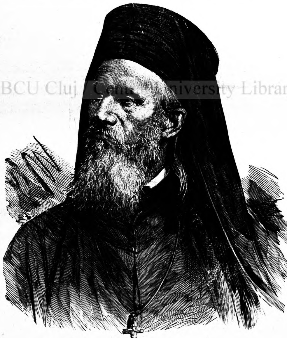
DR. SILVESTRU MORARIU-ANDRIEVICI.

Prețul pe un an 10 fl. Pe \frac{1}{2} de an 5 fl. Pe \frac{1}{4} de an 2 fl. 70 cr. Pentru România pe an 25 lei