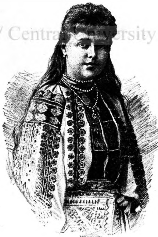
PRINCESA MARIA A ROMÂNIEI.