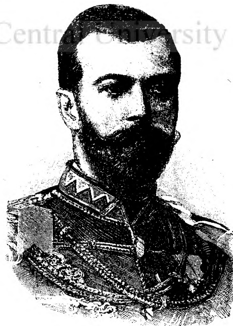
MARELE DUCE NICOLAE, moștenitorul Rusiei.