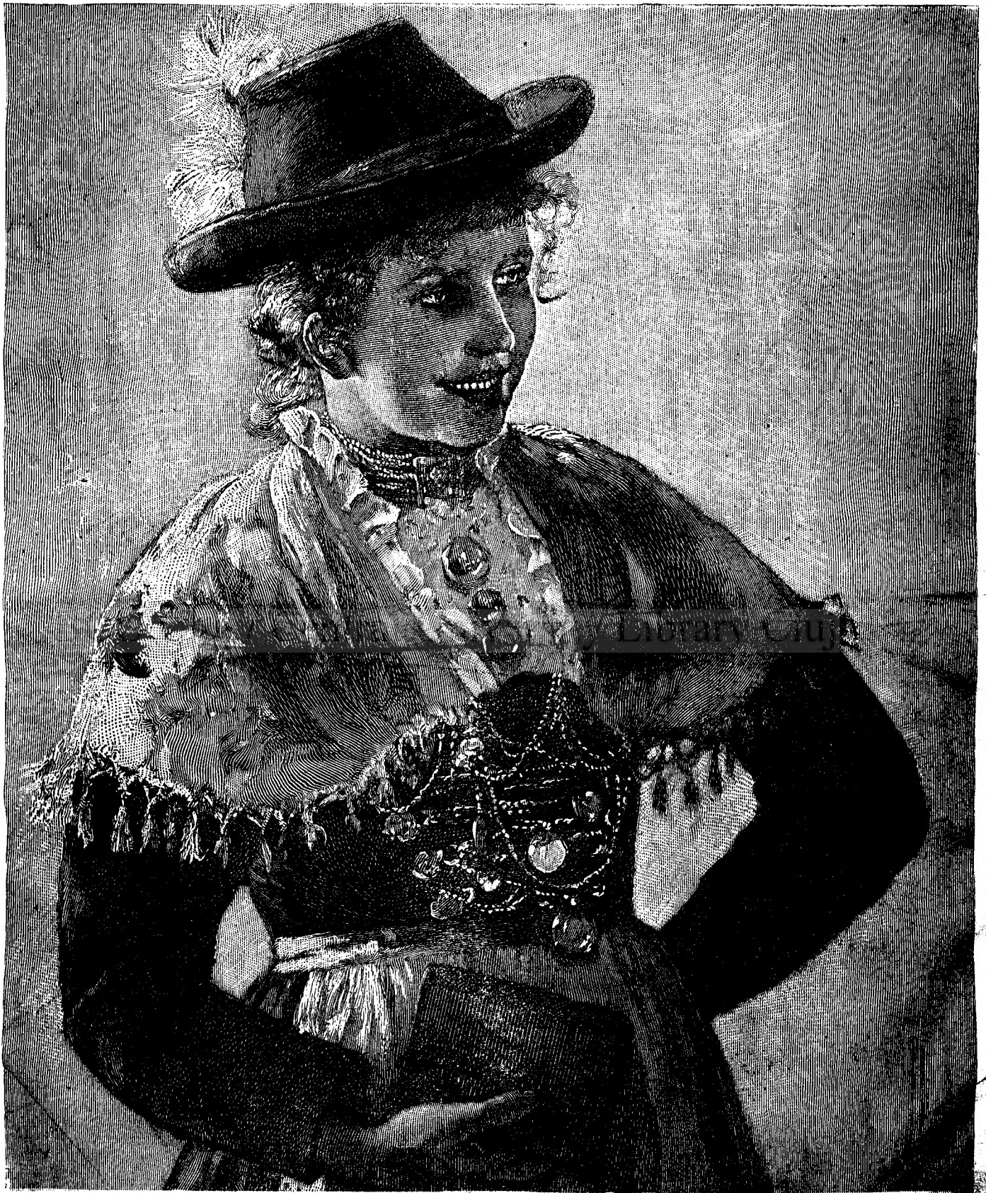
Fată din Salzburg.